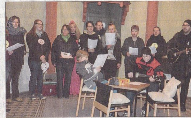
Singend stimmen die Mitarbeiter der Jugend- und Behindertenhilfe auf Weihnachten ein.