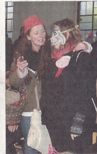
Das Rotkäppchen in Aktion.