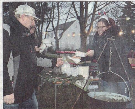
Zum Aufwärmen gibt es neben Punsch auch leckeren Grünkohl.